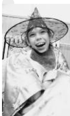
Een toverhoed maakt vrolijk

Uw bijdrage is zeer welkom o.v.v. code 9334, Moskou