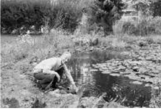
Meer tijd voor mezelf