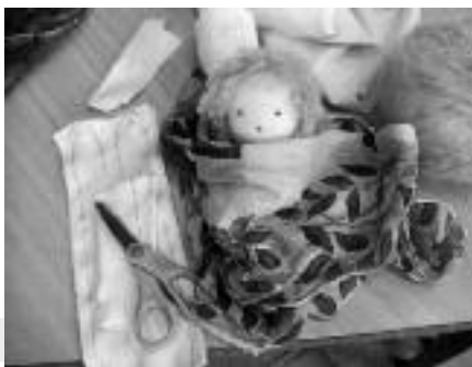
Popje in wording