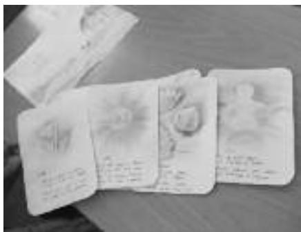
Gebundeld tot boekjes

De Zomeracademie in Semily, Tsjechië, die van 11 tot 19 juli 2009 - nu al voor de 17e keer - gehouden werd, is een onderdeel van de opleiding voor vrijeschoolkleuterleidsters in Oost-Europa. Behalve uit Tsjechië komen de studenten uit Slowakije, Rusland, Oostenrijk, Roemenië, Slovenië en Duitsland. De Duitse, Tsjechische en Nederlandse docenten vormen een hecht team waar enthousiasme en deskundigheid van uitgaat. Ik werd er - als vreemde eend in de bijt - heel vanzelfsprekend in opgenomen. Het was een uitgelezen mogelijkheid om leerkrachten uit diverse Oost-Europese landen te ontmoeten en nieuwe contacten te leggen.