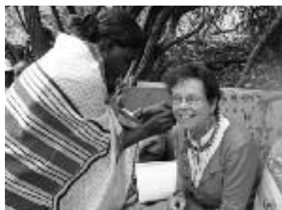
We worden gedecoreerd

ze zien er zo gezond uit, zijn zo zelfbewust, kijken zo helder uit hun ogen en spreken zo goed Engels! Het feest werd besloten met een maaltijd en een fotosessie waarbij alle kinderen, ook die van de wachtlijst, op de foto mochten. Tenslotte werden we alle hutten binnengenoemd en kregen nog meer sieraden, genoeg om iedere sponsor iets unieks op te sturen. Op de terugweg spookte er maar één gedachte door mijn hoofd: "Hoe vind ik sponsors voor alle 25 kinderen die ik op de foto heb gezet!"