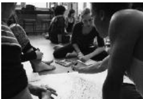
Brainstormen bij IDEM

Overigens heeft de Mbagathi School de beschreven periode goed doorstaan en zich ontwikkeld tot een succesvolle schoolgemeenschap waar 270 leerlingen uit uiteenlopende milieus samen leren, spelen en leven.