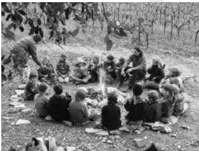
Caminarem houdt het vuur brandend

De Franse Steiner scholen zijn 100% particulier. Dat wil zeggen