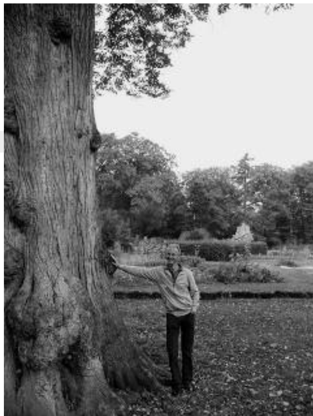
Deze keer geen fruitboom