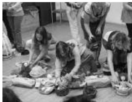
In de stroom