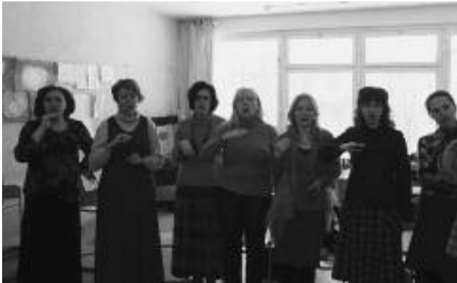
Zingen in Moskou

De opleiding muziektherapie van het Ita Wegman Opleidingscentrum begon in juni 2008 met een introductie cursus en een eerste cursusblok in november. De deelnemers worden opgeleid om te werken met mensen met een beperking, om therapeutische hulp te bieden aan kinderen in het gewone onderwijs en bij medische problemen. In de schoolvakanties wordt gedurende 3 jaar in blokken les gegeven. Daarna volgt een stageperiode. De studenten komen niet alleen uit Moskou, Smolensk en Sint Petersburg maar ook uit Siberië, Wit-Rusland en Armenië. Voor sommigen was dit het eerste, voor anderen het tweede blok. Tijdens mijn bezoek gaf ik o.a. van zondag t/m woensdag telkens twee lessen van 1½ uur.