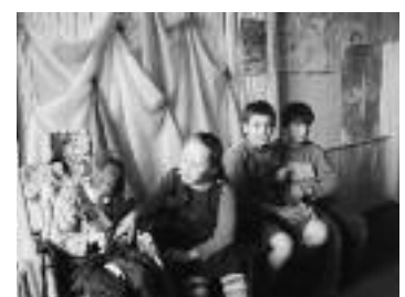
Naar de Turmaline klas