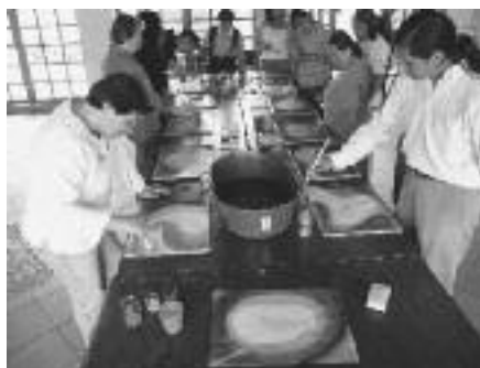
Vorm en kleur komen te voorschijn

Steun de scholen met uw bijdrage o.v.v. code 9289 (Micael) en 92891 (Niña Pacha) en code 9284 (Costa Rica)