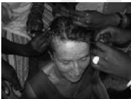
Met Guinese handen in mijn haar

"Ik werk op de vrijeschool, heb een sabbatical year genomen i.v.m. mijn wiskundestudie, wilde toen ook een oude droom waarmaken, kwam na 10 jaar in contact met een vriendin van vroeger omdat ik een overlijdensadvertentie van háár beste vriendin zag. We maakten een afspraak. Mijn zoektocht naar een plek sloot naadloos aan bij de stap waar háár project aan toe was: werken met kinderen. Grappig genoeg heb ik 10 jaar geleden, tijdens mijn eerste jaar op de Stichtse bovenbouw, met een zevende klas een Afrikaans scheppingsverhaal opgevoerd. Toen heb ik haar en haar Guinese partner gevraagd met de leerlingen Afrikaans dansen te doen: djembé spelen met de jongens en dansen met de meisjes. Het was een groot succes; nooit kunnen voorspellen dat we tien jaar later samen in Afrika zouden zijn!"