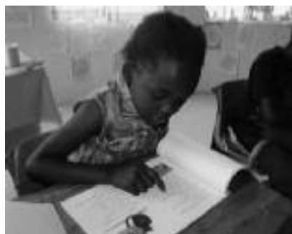
Lezen op niveau

Voor eersteklassers is Engels een nieuwe taal en het kost veel moeite die te leren. Vaak begrijpen de kinderen de door de leerkrachten in het Engels gegeven uitleg niet en zien de leraren zich genoodzaakt terug te vallen in de moedertaal. Het gevolg is een gemiddelde leesachterstand van 1 à 2 jaar die de leerlingen niet meer inhalen. De Inkanyezi School wilde deze taalachterstand graag aanpakken, maar het ontbrak de school aan geschikt lesmateriaal. Door de schenking van het IHF was het mogelijk voor alle klassen vanaf de derde, voldoende boeken aan te schaffen om elk kind op zijn eigen niveau Engels te laten lezen. De leerkrachten hebben meegedaan met een workshop over het leesonderwijs en een uitgebreide reader helpt hen verder bij het lesgeven. Ook zijn er boeken aangeschaft