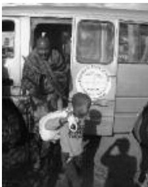
Met de bus Masailand in

Een week lang bezocht ik alle klassen, heb ik de via het IHF gesponsorde Masai kinderen geobserveerd en sprak ik met schoolleiding, bestuur en alle medewerkers. De Mbagathi School is een school waar je je als kind heel gelukkig voelt, is mijn indruk. Ik deelde het ontbijt en avondeten met de 75 internaatskinderen en lunchte met alle 275 scholieren: groenten en fruit uit eigen tuin, melk van de eigen koeien en dagelijks vers gebakken brood. Er was nog een groot schoolfeest waar de klassen aan elkaar en aan de ouders lieten zien wat ze de afgelopen tijd geleerd hadden en toen begon de vakantie met een speciaal avontuur.