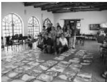
Grondbeginselen van het schilderen