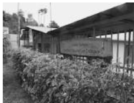
Het Juan Viñas schooltje