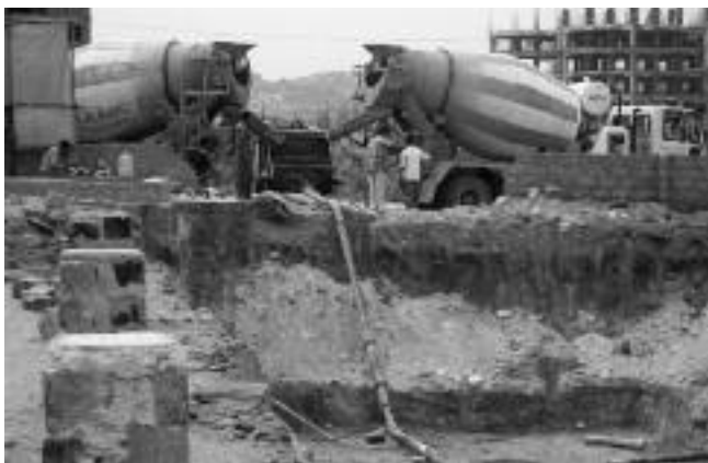
De basis wordt gelegd

In Hyderabad, India, staan vier vrijescholen. De Slokaschool die in 1997 z'n deuren opende, is de oudste. In 2001 werd Diksha opgericht, een jaar later Prerana, en nog weer een jaar later Abhaya. Twee van de vier scholen zagen zich de laatste tijd gedwongen te verhuizen vanwege de exorbitante vastgoedprijzen: Diksha en Prerana. In Vietnam begon in 2002 een kleuterschooltje in het boeddhistische nonnenklooster Dieu Giac, van daaruit zijn nog twee kleuterschooltjes opgericht Thanh Lan Kindergarten en Tho Trang Child Centre. Dit laatste schooltje ziet zich ook gedwongen te verhuizen, zij het om een geheel andere reden.