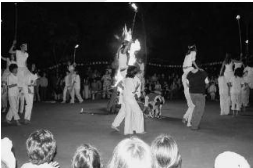
St. Jansfeest in de winter bij Aitiara