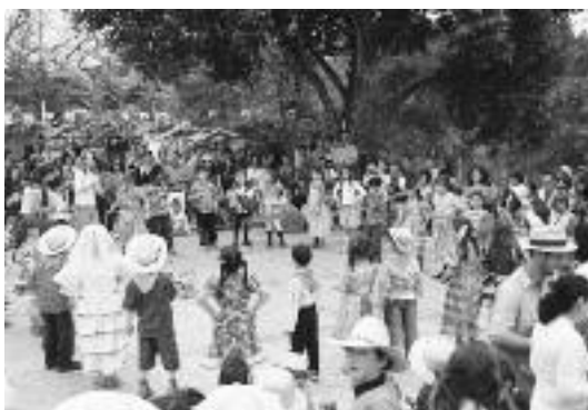
Het Junina winterfeest

Intussen zijn we dik een jaar verder. Waar straks de nieuwe bovenbouw verrijst, gaapt nu een krater in de rode grond, gegraven in de wintervakantie in juli. Het begin is er, nu nog het geld. Het liefst zou de schoolleiding weer met de pet rondgaan bij ouders, onderwijzers en vrienden van Novalis. Op die manier - en met de inzet van ouders die hun paasdagen opofferden voor het storten van vloeren - kwam de vorige nieuwbouw tot stand. Veel