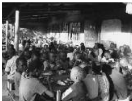
Steeds at ik met de kinderen