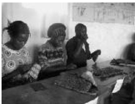
De tassen worden mooier en mooier