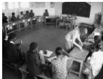
De opleiding is niet meer weg te denken