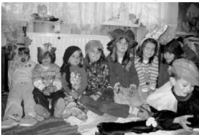
De prins uit het sprookje

Het herstel van de materiële schade is de laatste jaren op gang gekomen, mijnenvelden zijn afgebaand of geruimd, wegen en gebouwen opgelapt of herbouwd, maar aan het herstel van de psychische schade - het ontmissen van ziel en geest - is weinig aandacht besteed. Duurzame vrede en stabiliteit vragen een 'psycho-socio-culturele' aanpak gericht op het vrijmaken en versterken van veerkracht en initiatiefkracht. Dat is wat Crea Thera gefaseerd wil realiseren.