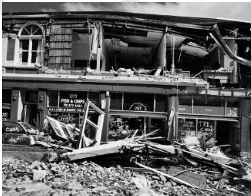
Winkelstraat in Christchurch

Uw bijdragen kunt u storten o.v.v. code 8290, Christchurch