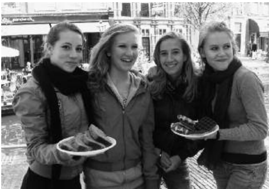
Lekkere hapjes van het Marecollege