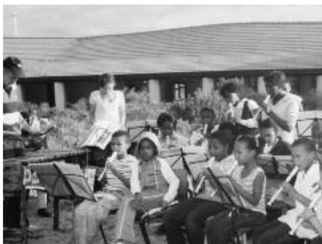
Heerlijk buiten muziek maken

Vorig jaar november kwam er een noodkreet uit Zuid-Afrika van de Hermanus Waldorf School in het stadje Hermanus. Vanwege de financiële situatie wist de van donaties afhankelijke school niet of ze in januari haar deuren weer zou kunnen openen voor de ruim 200 kinderen uit de achterstandswijken Zwelihe en Mount Pleasant. Om over de december salarissen van de leerkrachten nog maar niet te spreken. Vanuit Zuid-Afrika, Europa en Australië kwam er hulp en het goede nieuws is dat 18 januari 2011 alle kinderen weer naar hun geliefde school konden gaan!