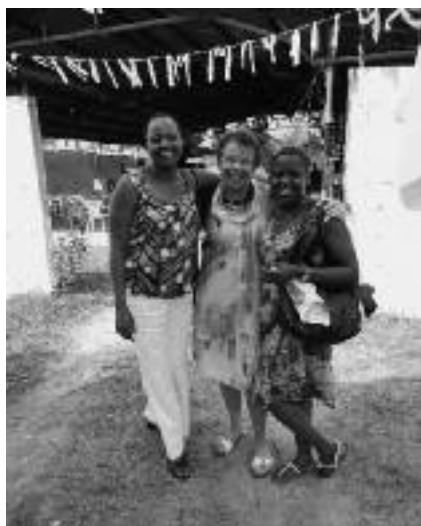
Ontmoetingen in de vrije uurtjes

De laatste avond was er feest. Heerlijk eten, iedereen, ook ik, zong het volkslied van z'n land en daarna waren er optredens van de verschillende scholen. Er werd uitbundig gedanst en gezongen zodat ik onwillekeurig moest denken aan de kleuters die dit alle-