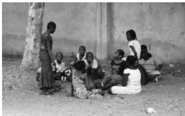
Op het schoolplein

De kinderen waren ook anders dan in Nederland. Ze waren enorm leergierig, wilden constant zien wat ik deed, stelden vragen en waren jaloers wanneer ik een van hun klasgenootjes meenam om samen met mij te schilderen. Hun geestdrift voor alles was overweldigend! Voor mij was het een echte uitdaging om grenzen aan