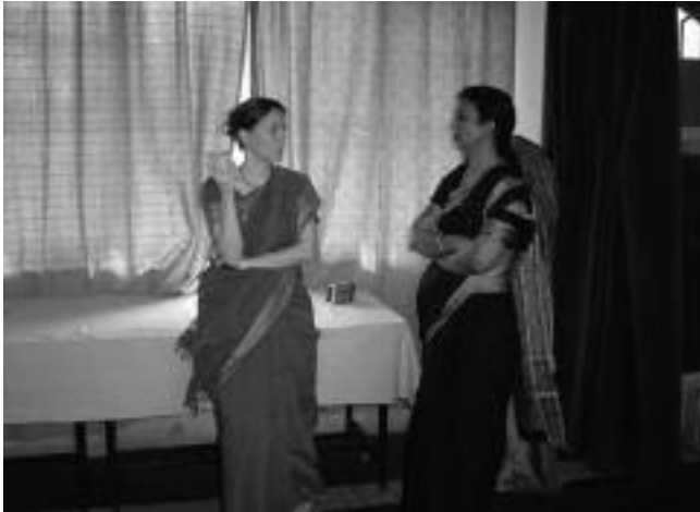
Voor Indira Varma heb ik veel bewondering

Grappig trouwens dat ik als zzp-er nu terugga naar de basis en weer voor de klas sta."