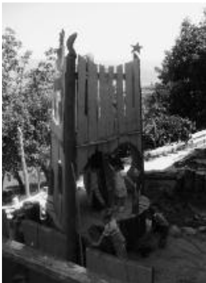
De Phoenix tuin

Uw schenking kunt u storten o.v.v. Phoenix code 9337