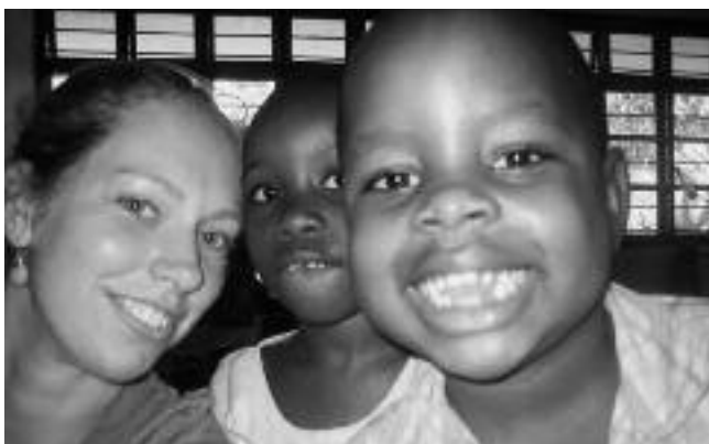
Lucian op Hekima

De Hekima Waldorf School in Dar es Salaam, Tanzania is 14 jaar geleden opgericht door twee Tanzaniaanse echtparen. De school heeft een kleuterklas met 35 kleuters en een onderbouw met 170 leerlingen. Hieronder het enthousiaste relaas van een Nederlandse stagiaire die er enige maanden verbleef.