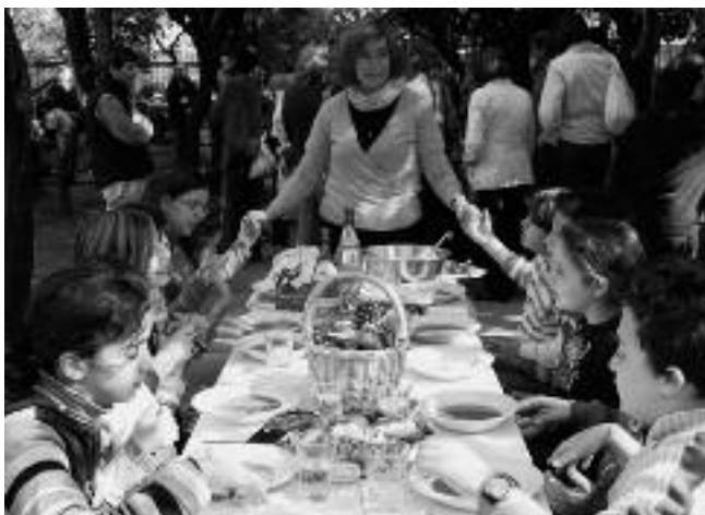
Herfstfeest 5e klas