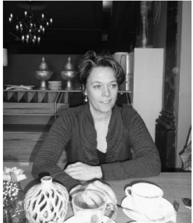
Met mijn directheid kon ik orde op zaken stellen