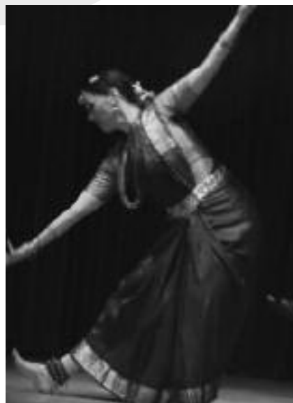
Een klassieke Indiase dansopleiding

Ik heb een 8,9 voor mijn statistiek gehaald. Zet dat er maar in, daar ben ik hartstikke trots op. Zet mijn website ook maar bij het artikel ( www.de-vrije-ruimte.nl ) dan kunnen ze me inhuren.