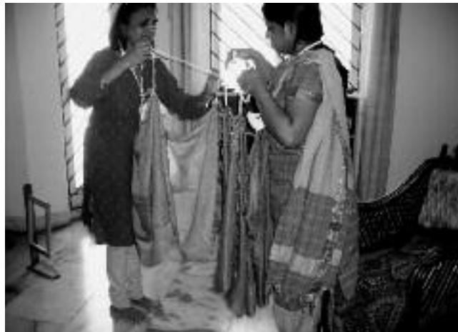
Marionetten maken met dupatta's

ligt op de Indiase cultuur. Hij nodigde mij uit de pedagogische en spirituele kanten van het poppenspel te laten zien en zo stond ik de volgende dag voor 90 leerkrachten uit 13 verschillende staten van India. Ik heb toen het transparantenspel laten zien en daarna de knooppoppen gemaakt van zakdoeken en dupatta's. Terwijl ik met 90 mensen, voornamelijk mannen, dieren en poppen knoopte van doeken, kon ik beleven hoe vanzelfsprekend voor hen spiritualiteit nog is.