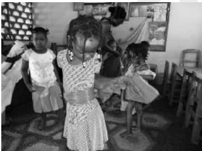
Mooi maken voor de bruiloft

Al gauw bleken er nog heel wat meer verzoeken te liggen en toen was het besluit snel genomen. Zo vertrok ik met een koffer vol geschenken voor de verschillende projecten en een hoofd vol ideeën over de te houden lezing op 5 februari heel vroeg naar Schiphol om via Zürich en Nairobi 's avonds in Dar es Salaam te landen. Twee leerkrachten van de school stonden op mij te wachten en het was een warm weerzien. Februari is de heetste maand in Tanzania en buiten op het vliegveld hing, ook al was het 9 uur 's avonds, zo'n vochtige drukkende hitte alsof er ieder moment een onweersbui zou kunnen losbarsten. Het is iedere keer weer een bijzondere ervaring om 's morgens met een dikke winterjas aan te vertrekken en 's avonds blij te zijn om onder een koude douche te kunnen afkoelen!