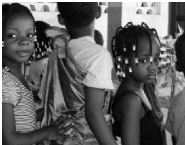
Met de bus naar de kapper

Naast het eten koken en kinderen verzorgen wordt een verjaardag bijv. gevierd met een supergrote verjaardagstaart (van blokken).