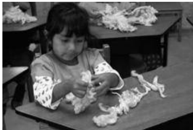
Een engel Michael maken van schapenwol