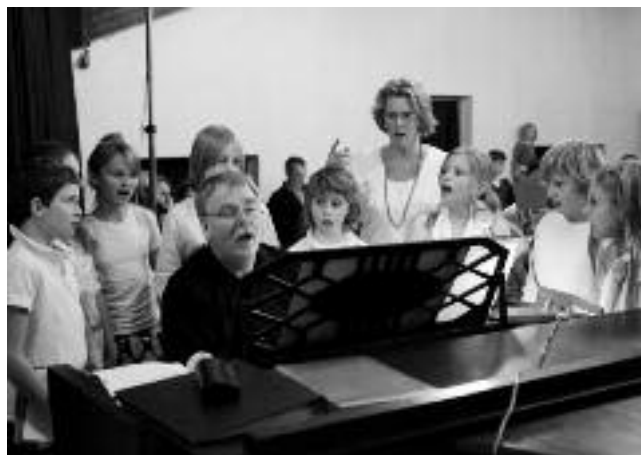
Kinderen van de Michael School Bussum

Op 12-12-2012 hebben we een concert gegeven samen met de kinderen van klas 4, 5 en 6. Het was een prachtig, enthousiast concert. De kinderen zongen herfstliederen, twee liederen uit "les Choristes" en het Lucialied. Het Koor in 't Gooi had een mooi internationaal kerstrepertoire. Samen hebben we "Susa Ninja" gezongen en "Ubi sunt Gaudia". Ook speelde een vader als intermezzo een prachtig stuk op de klassieke gitaar. Het applaus van het publiek, dat voor een groot deel moest staan, was hartverwar-