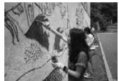
Armeense en Georgische leerlingen beschilderen samen de muur