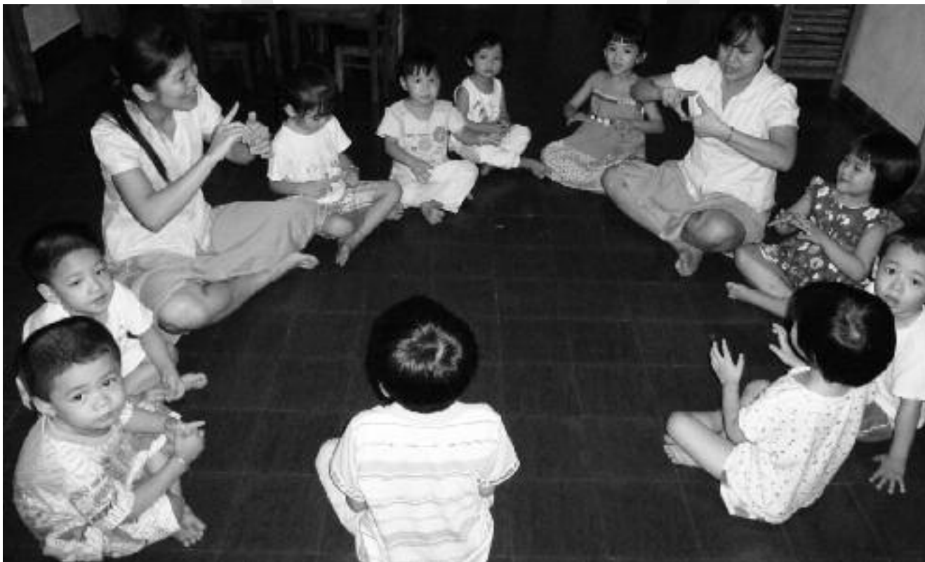
Kleuterklas Tho Trang

U kunt uw gift voor de kleuterscholen in Vietnam overmaken o.v.v 9347.