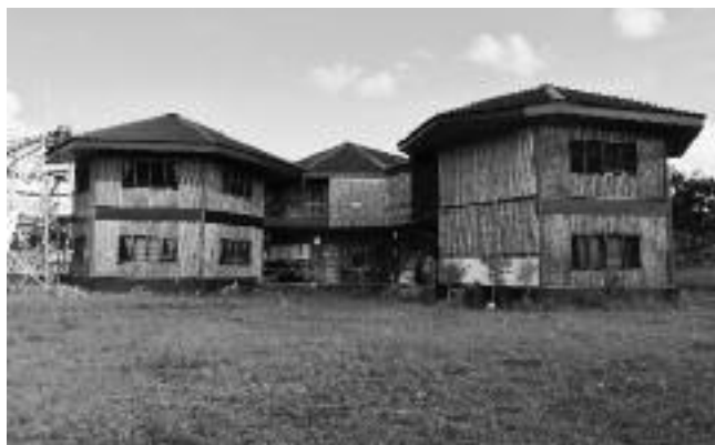
De Gamot Cogonschool wordt hersteld

De Gamot Cogon School in de Filippijnen (zie artikel in de vorige rOndbrief ) is recentelijk zwaar getroffen door overstromingen als gevolg van een tyfoon. Er zijn gelukkig geen slachtoffers gevallen, maar de ravage was enorm. Het IHF heeft uit het noodfonds financiële steun kunnen verlenen waardoor schade kon worden hersteld en verloren gegaan lesmateriaal weer kon worden aangeschaft.