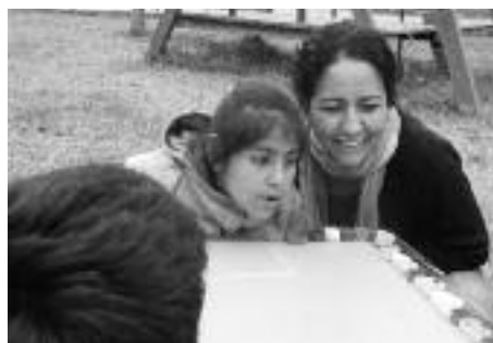
Zelfgemaakt blaasvoetbal voor kinderen met spierziekte

U kunt uw gift overmaken o.v.v. code- 30009287 Peru Algemeen; 30009288 Aynimundo; 30092881 Colegio Micael ; 30009292 Iniykusiry