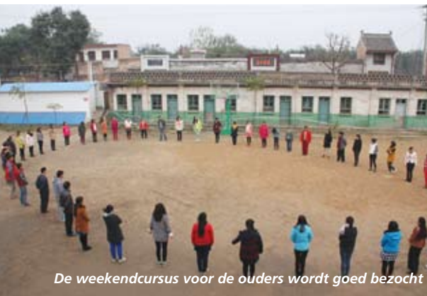
De weekendcursus voor de ouders wordt goed bezocht

*Hezhipan betekent "bij de rivier", de Gele Rivier.