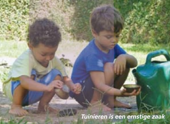
Tuinieren is een ernstige zaak