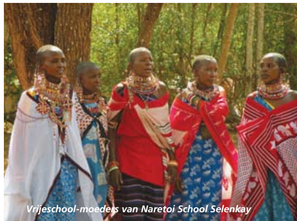
Vrijeschool-moederis van Naretoi School Selenkay