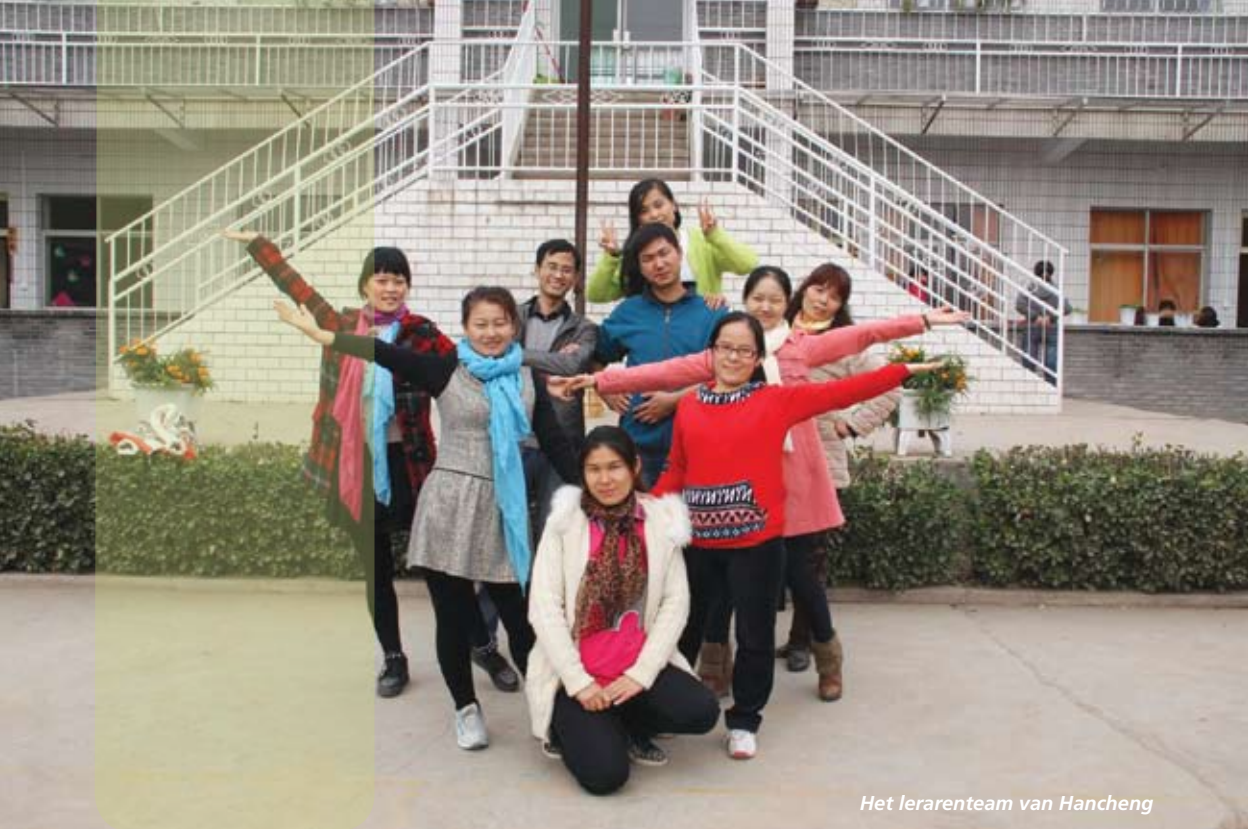
Het lerarenteam van Hancheng