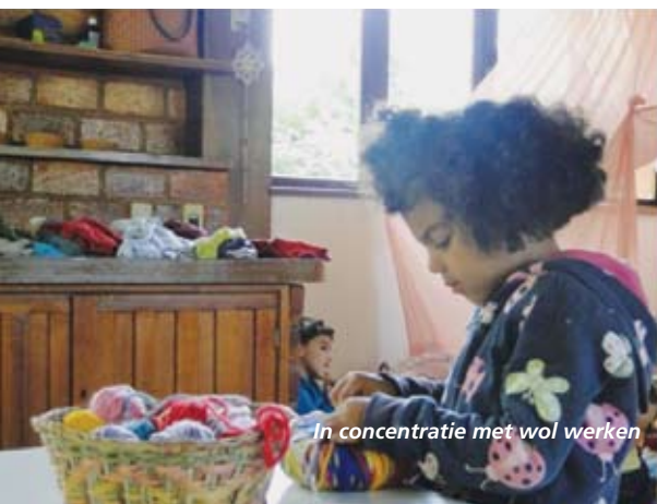
In concentratie met wol werken