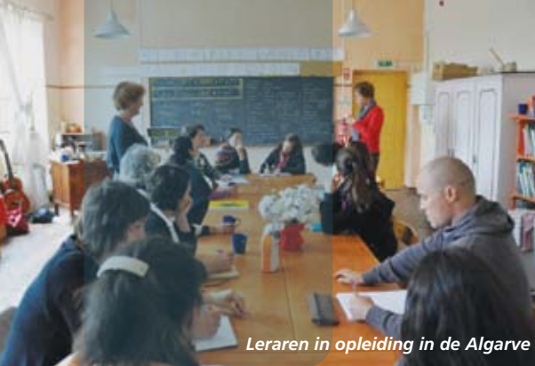
Leraren in opleiding in de Algarve