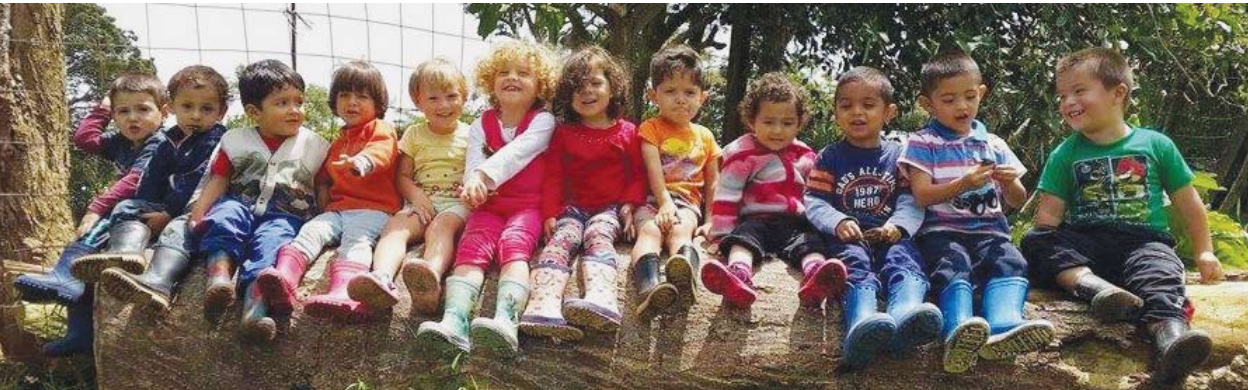
Kleuterschool El Huerto, Costa Rica