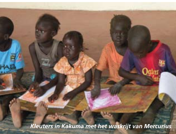
Kleuters in Kakuma met het waskrijt van Mercurius

Na Huize Thomas begon ik een opleiding aan de Alanus Hochschule für Bildende kunst. Hier ontmoette ik mijn vrouw. In Dornach deed ik een opleiding beeldhouwen. Na enige omzwervingen kwamen we via Brazilië, waar onze twee dochters geboren zijn, terug in Nederland. In 1985 werd mijn wens om op een Vrije School te werken vervuld, toen ik als leraar handenarbeid op het Parcival College te Groningen ging werken. Na dertig jaar ga ik nu met pensioen. Graag wil ik me inzetten voor de Vrije Schoolpedagogiek in het buitenland. In het verleden bezocht ik projecten voor het IHF onder andere in Portugal en Italië. Het portefeuillehouderschap West-Europa & Midden-Oosten geeft me de mogelijkheid om de opgebouwde contacten te verdiepen en uit te breiden.