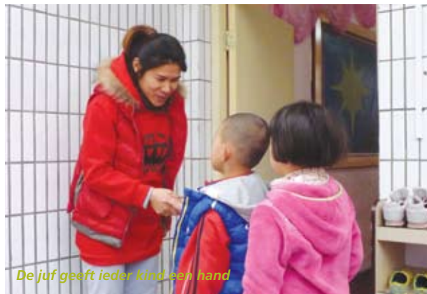
De juf geeft ieder kind een hand